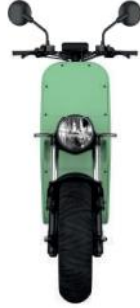
MILK & MINT